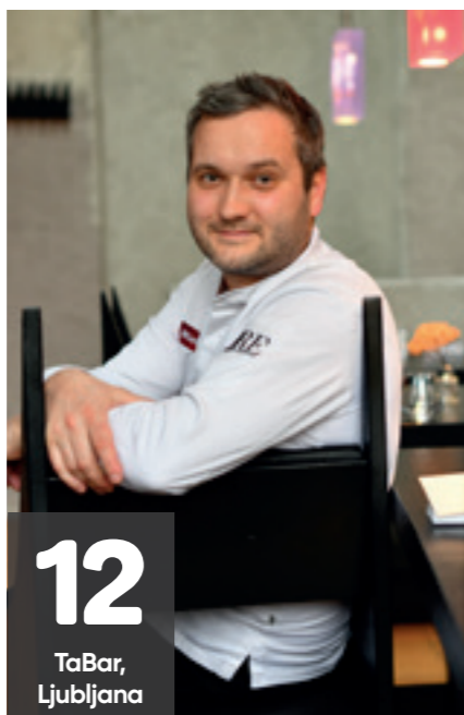
12 TaBar, Ljubljana