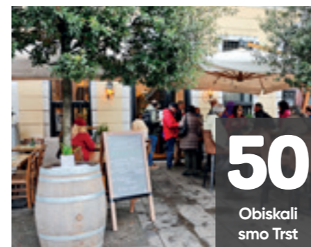
50 Obiskali smo Trst