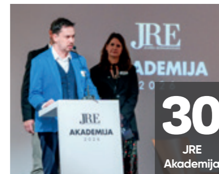
30 JRE Akademija