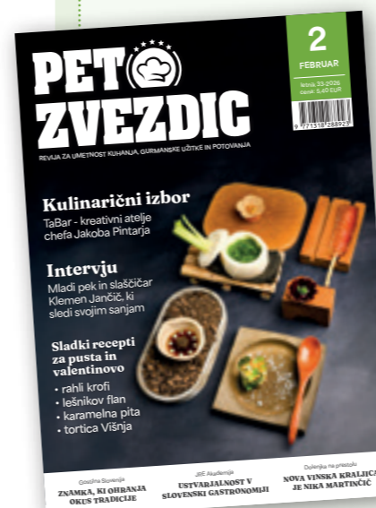
Naslovnica Peter Irman / TaBar, Ljubljana

Cena izvoda v prosti prodaji je 5,40 eur, cena izvoda za naročnike je 4,36 eur. Letna naročnina znaša 48 eur. Naročnina se sklence za nedoločen čas ter obdobje najmanj enega leta (12 števk, poletna je dvojna in stane v prosti prodaji 6,90 eur). Velja do pisnega preklica, odjavite pa se lahko najmanj 15 dni pred izidom naslednje številke.