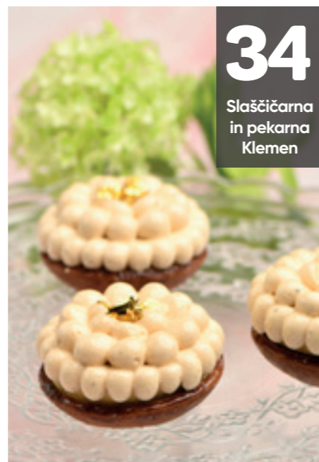
34 Slaščičarna in pekarna Klemen