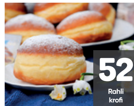
52 Rahli krofi