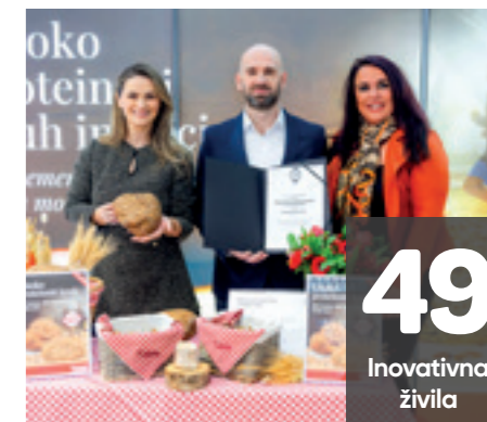
49 Inovativna živila

KVIZ: Gurman tudi po znanju UŽITNI CVETOV!