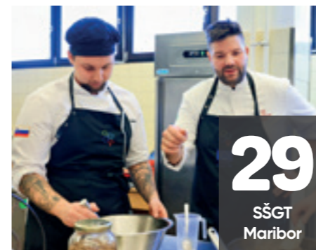
29 SŠGT Maribor